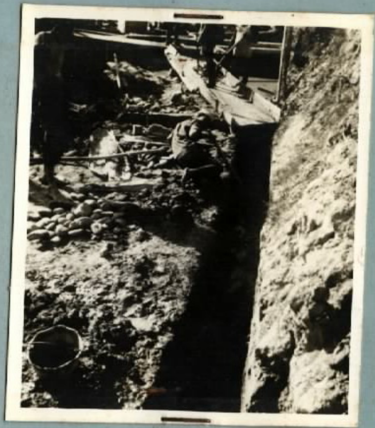
PENGGALIAN KUBUR SAJAP