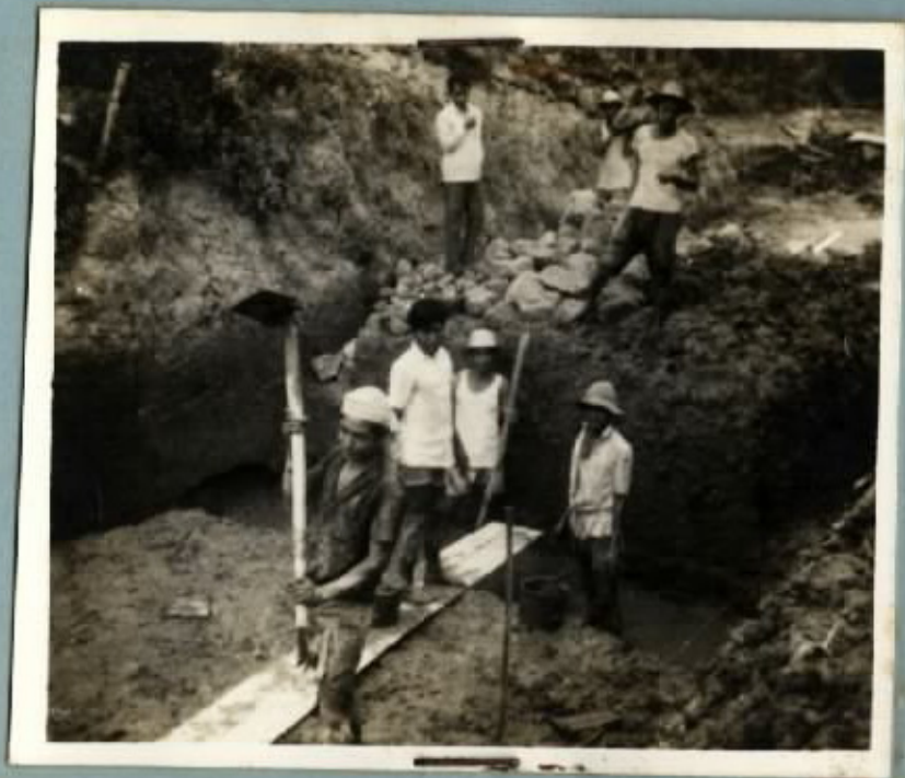
PENGGALIAN PONDASI LANTAI