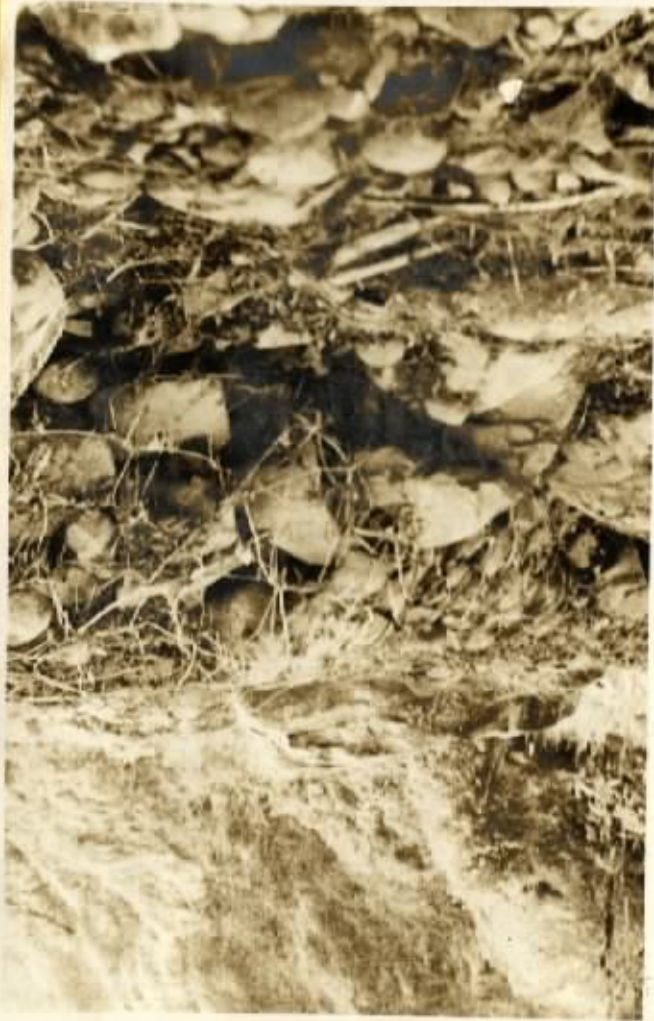
PRODUKSI DARI BELAKANG BERUNDONG KAWAT SELESAI 100%