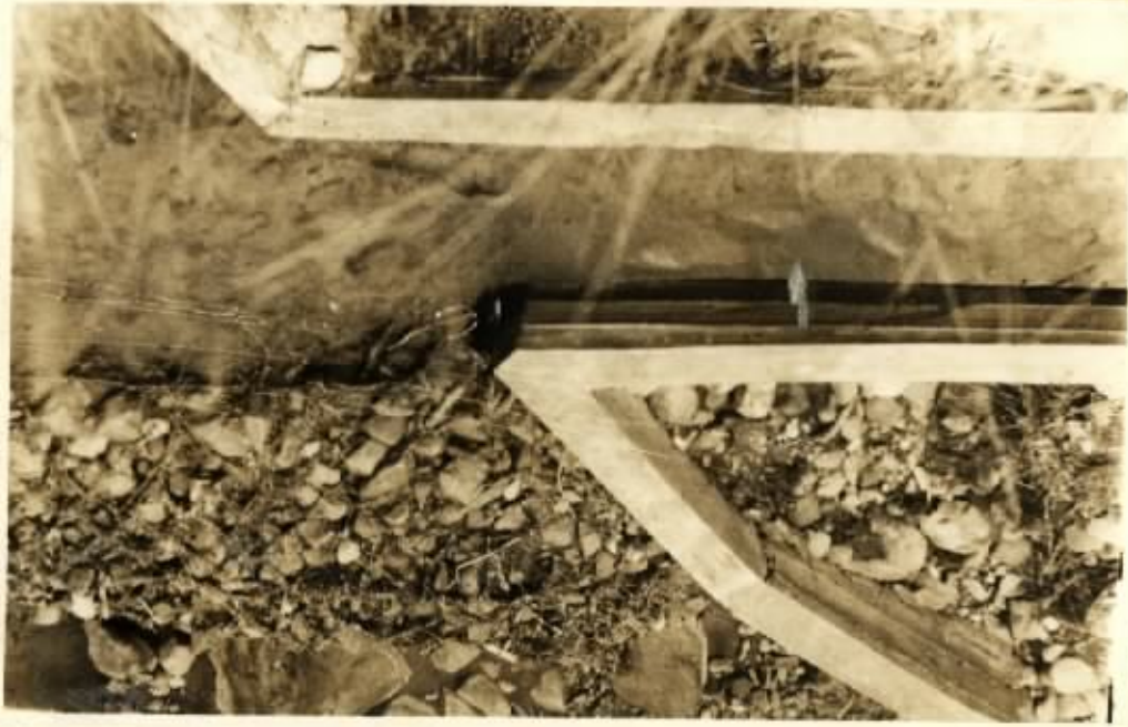
PHUDT NGANU DREI ATAS PINTU AIR, BERDONDONG SEL ESTI 100%